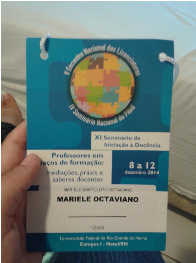
Foto 2. Crachá da aluna bolsista que apresentou o trabalho.