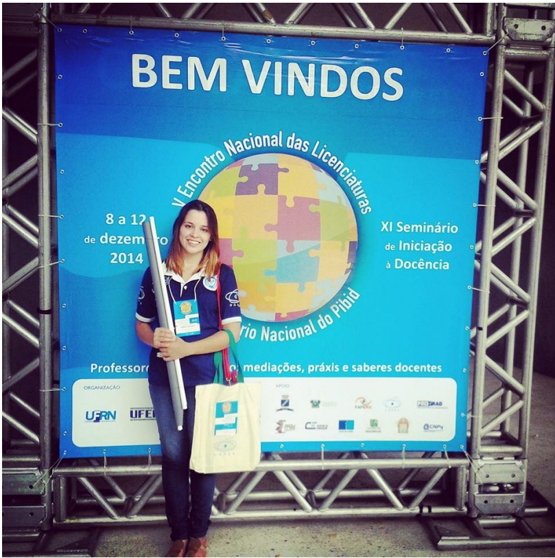
Foto 4. Aluna bolsista no ENALIC.