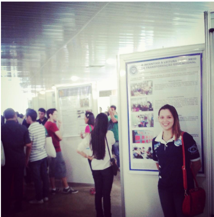
Foto 3. Aluna bolsista durante a apresentação dos painéis.