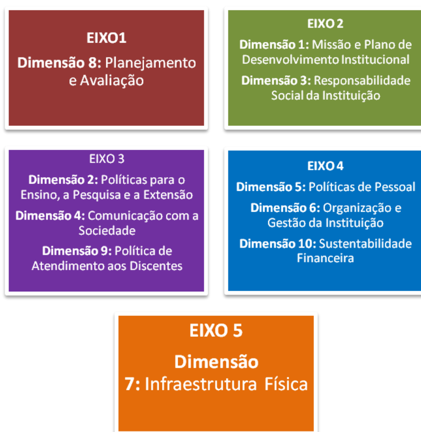
Figura 3: Eixos e dimensões contidos nos questionários

A avaliação institucional das Faculdades Integradas de Fernandópolis conta com diversificados instrumentos com o objetivo de buscar, constantemente, a melhoria da instituição. Entre os instrumentos utilizados, podem ser citados questionários, grupos focais e análise documental. Nesse sentido, acontece a avaliação das dez dimensões do Sistema Nacional de Avaliação da Educação Superior na IES, ilustrados na figura 3.