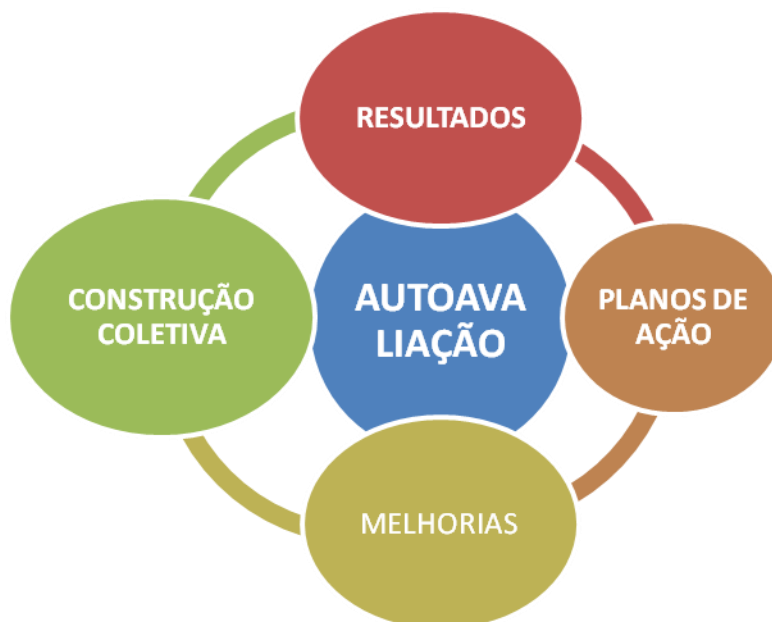
Figura 2: Princípios norteadores desta CPA