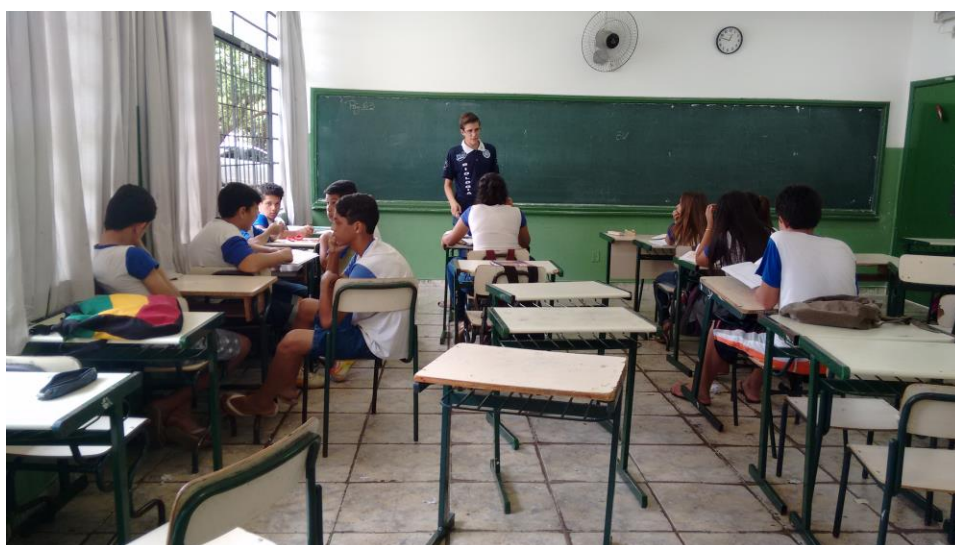
Foto 3: Aluno bolsista, orientado pela professora supervisora, explicando o experimento sobre eletricidade.