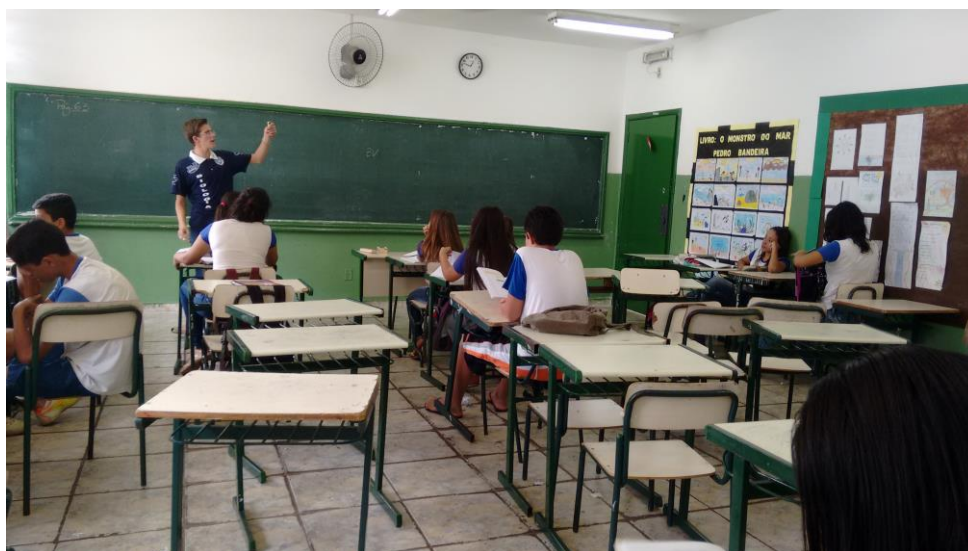
Foto 2: Aluno bolsista, orientado pela professora supervisora, explicando o experimento sobre eletricidade.