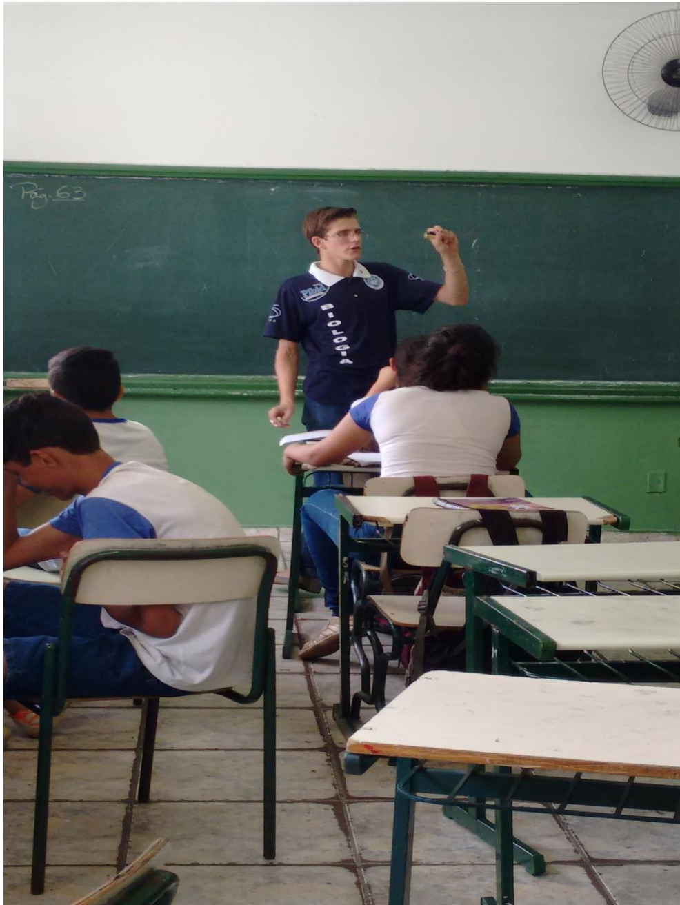
Foto 1: Aluno bolsista, orientado pela professora supervisora, explicando o experimento sobre eletricidade.