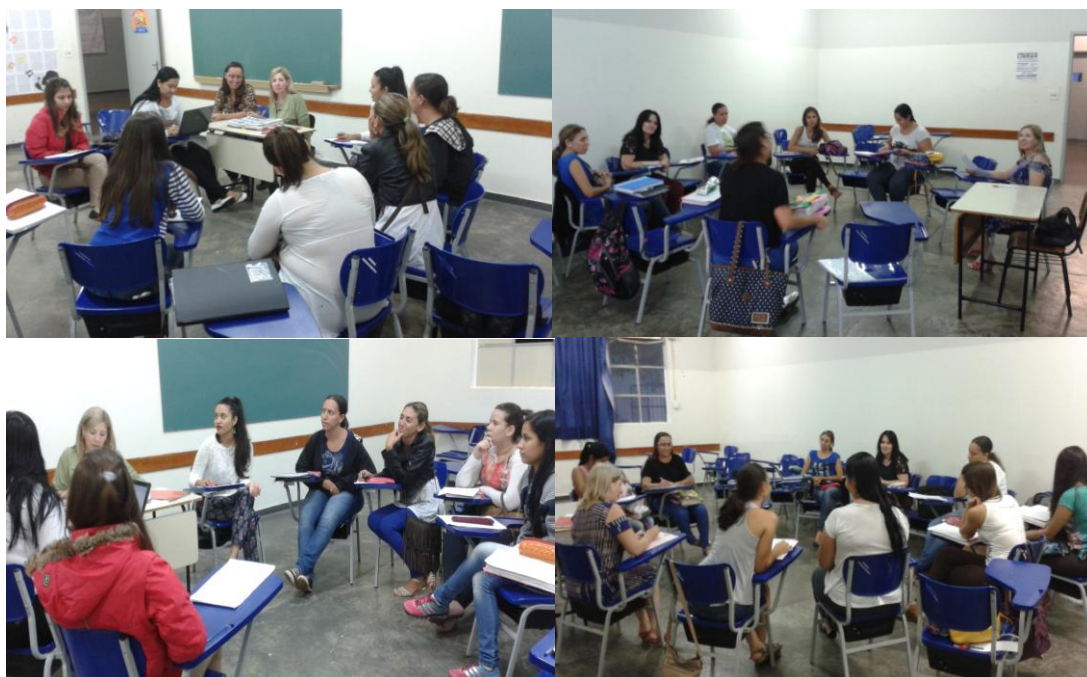
Reuniões de estudo

Tipo do produto: Projeto didático: As reuniões semanais oportunizaram momentos de reflexões enriquecedoras para todos os participantes, com registros reflexivos sobre as ações desenvolvidas no processo de aprender a ensinar.