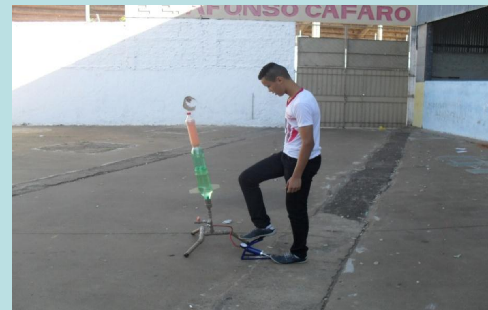
Evidências da atividade experimental do lançamento do foguete Imagens produzida por GOMES, J.U. em 09/04/2014