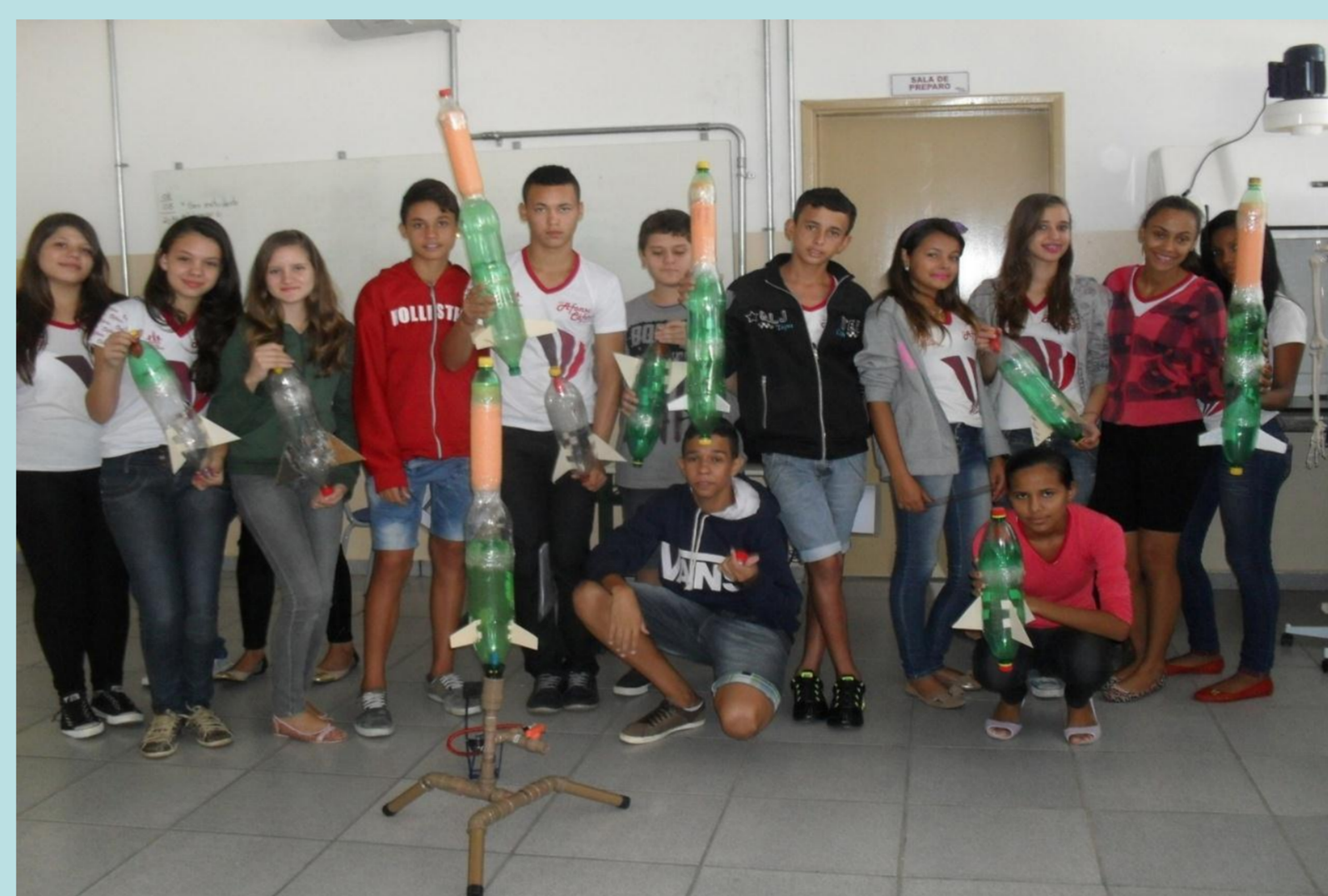
Evidências da participação dos alunos em 09/04/2014.