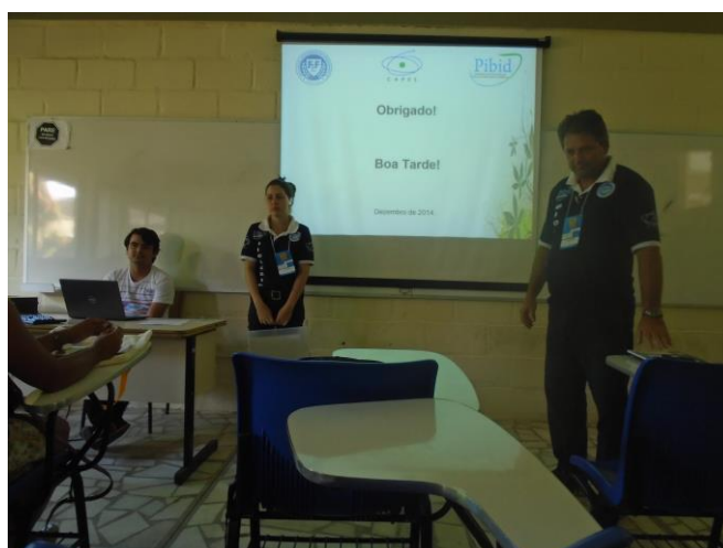
Foto 2: Apresentação do trabalho pelos alunos bolsistas, no V ENALIC/2014.