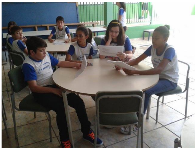
Foto 8: Alunos da 7ª série do Ensino Fundamental do Ciclo II, estudando as fichas sobre os métodos contraceptivos.