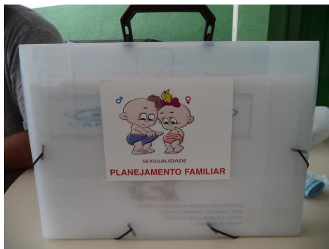
Foto 2: Maleta Sexualidade: Planejamento familiar, contendo fichas auto-explicativas de todos os métodos contraceptivos, confeccionada pelos alunos bolsistas.