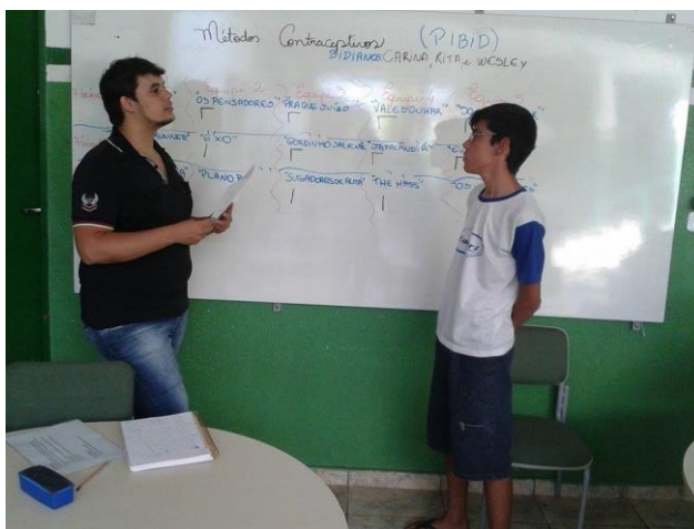
Foto 9: Aluno bolsista desenvolvendo o debate com aluno da 7ª série do Ensino Fundamental do Ciclo II, sobre os métodos contraceptivos.