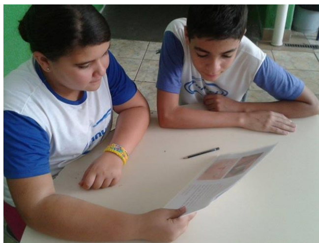
Foto 7: Alunos da 7ª série do Ensino Fundamental do Ciclo II, estudando as fichas sobre os métodos contraceptivos.