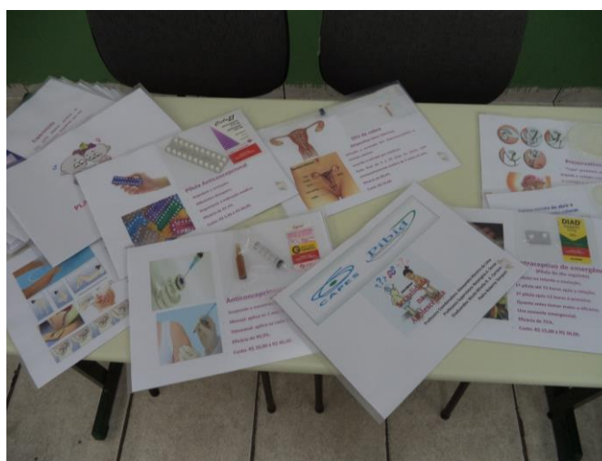
Foto 4: Fichas auto-explicativas de todos os métodos contraceptivos, confeccionadas pelos alunos bolsistas.