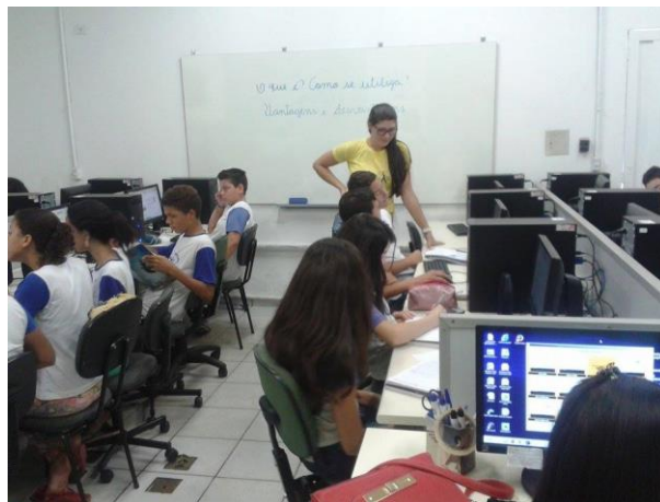
Foto 6: Aluna bolsista na sala de informática, com alunos da 7ª série do Ensino Fundamental do Ciclo II, desenvolvendo a pesquisa sobre os métodos contraceptivos.