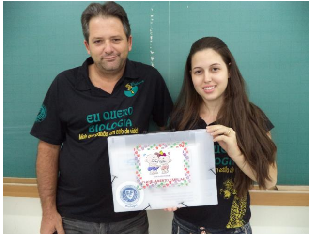
Foto 5: Alunos bolsistas que confeccionaram a Maleta Sexualidade: Planejamento familiar, com todas as fichas auto-explicativas dos métodos contraceptivos.